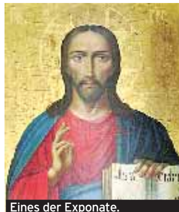
Eines der Exponate.

In der Galerie Henarte in Málaga (C/Comandante Benítez) werden zurzeit russische Ikonen aus dem 17., 18. und 19. Jahrhundert ausgestellt. Diese religiösen Werke wollen keine realistische Darstellung, sondern auf allegorische Weise eine Konzeption der religiösen Vorstellungen des Universums bieten. Der Künstler kann seine Bildsprache nicht frei wählen, sondern muss sich an einen fest vorgeschriebenen ikonographischen Kanon halten und die Tradition in der Darstellung der Heiligen ihrer Kleidung und Attribute einhalten. Zudem gibt diese Kunstform auf pädagogische Art Aufschluss über das russische Religionsempfinden. Die Ausstellung kann bis zum 3.