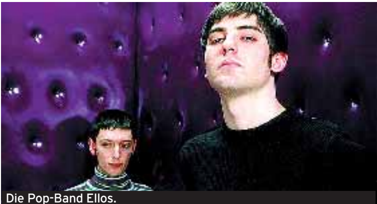
Die Pop-Band Ellos.

HÖHEPUNKTE DES KULTUR- UND FESTPROGRAMMES DER COSTA DEL SOL