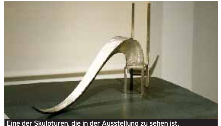
Eine der Skulpturen, die in der Ausstellung zu sehen ist.